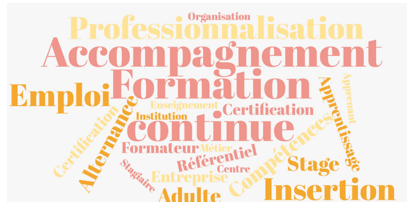
Nuage de mots créé suite à un ice-breaker