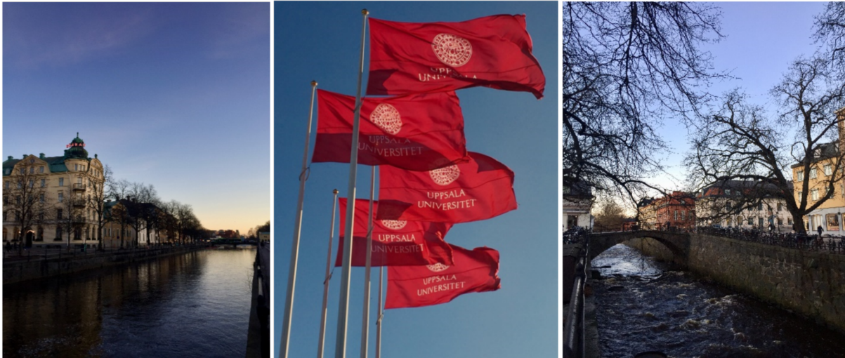
La ville d'Uppsala.

choix de mes cours et de mon logement. Je logeais en corridor avec 12 autres étudiants dont seulement 2 Suédois ! Les Suédois sont très intéressés par les autres cultures du monde. La vie y est chère, il faut prévoir un bon budget afin d'amortir son arrivée et de pouvoir découvrir le pays. La Suède regorge de magnifiques paysages – il faut absolument visiter la Laponie au nord pour voir les aurores boréales ! Je dirai que son ouverture sur le monde caractérise fortement la Suède, et ça m'a beaucoup aidé à m'intégrer au pays et à m'y sentir comme chez moi pendant quelques mois. Au niveau des cours, le rythme est plutôt calme à Uppsala. Je n'avais qu'une dizaine d'heures par semaine mais au moins la même quantité en travail personnel. Les enseignants sont passionnés et les cours sont très interactifs. C'était très enrichissant de découvrir un nouveau système universitaire et une culture que je ne connaissais pas du tout. J'ai adoré mon expérience Erasmus et je recommande fortement la Suède comme destination.»