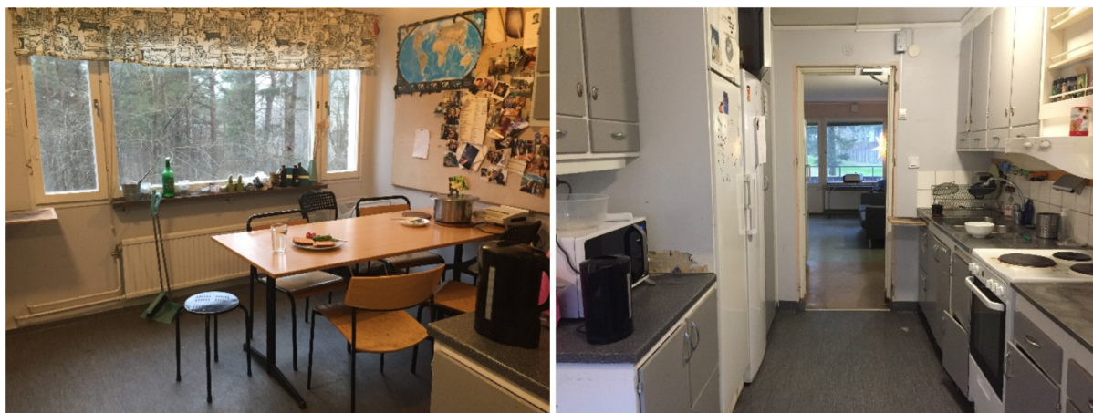
Un exemple de cuisine partagée dans un corridor à Uppsala.

Site d'hébergement étudiant Uppsala https://housingoffice.se/